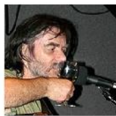
Open Mic POTRVÁ #35 Jun 2, 2010 photos: 70