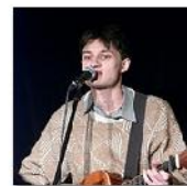
Open Mic POTRVÁ #30 Jan 6, 2010 photos: 35