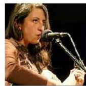
Open Mic POTRVÁ #34 May 5, 2010 photos: 66