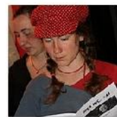
Open Mic POTRVÁ #43 Apr 6, 2011 photos: 76