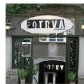
Open Mic POTRVÁ #45 Jun 1, 2011 photos: 93