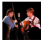
Open Mic POTRVÁ #47 Oct 5, 2011 photos: 39