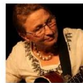
Open Mic POTRVÁ #44 Mcy 4, 2011 photos: 95