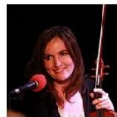
Open Mic POTRVÁ #40 Jan 5, 2011 photos: 83