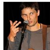
Open Mic POTRVÁ #37 Oct 3, 2010 photos: 84