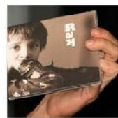
Open Mic POTRVÁ #46 Sep 7, 2011 photos: 67