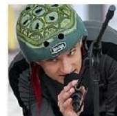
Open Mic v Belgické Sep 25, 2010 photos: 252