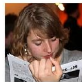
Open Mic POTRVÁ #39 Dec 8, 2010 photos: 71