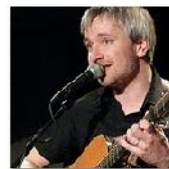
Open Mic POTRVÁ #33 Apr 7, 2010 photos: 67