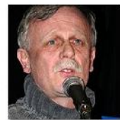
Open Mic POTRVÁ #32 Mar 3, 2010 photos: 90