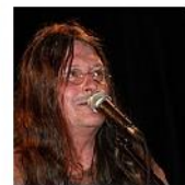
Open Mic POTRVÁ #36 Sep 1, 2010 photos: 149