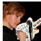
Open Mic POTRVÁ #38 Nov 3, 2010 photos: 73