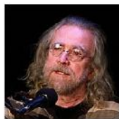
Open Mic POTRVÁ #41 Feb 9, 2011 photos: 76