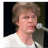
Open Mic POTRVÁ #26 Sep 2, 2009 photos: 60

že těmto posluchačům stačí málo. Na druhé straně oceňuji jejich toleranci, která není vlastní – a je to tak v pořádku – rockerům a undergroundákům.