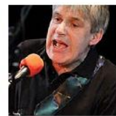
Open Mic POTRVÁ #42 Mar 2, 2011 photos: 138