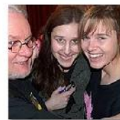
Open Mic POTRVÁ #31 Feb 3, 2010 photos: 91